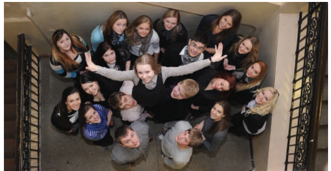
VALDŽIA. Pedagogikos fakulteto studentų atstovybei vadovauja mergina – kaip ir visų kitų KU fakultetų atstovybėms.