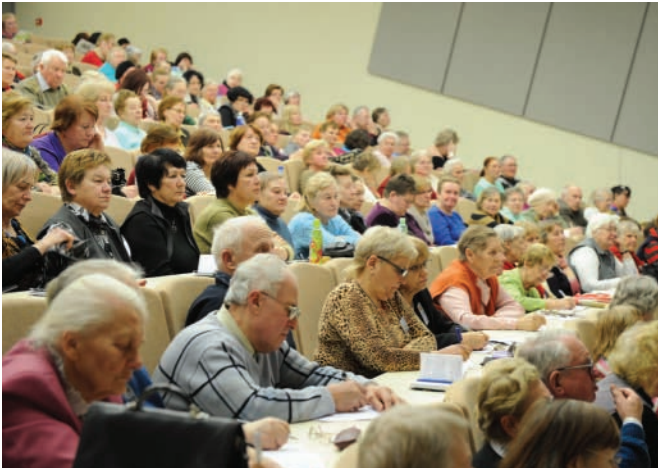
SENJORAI – STUDENTAI. Aktyvūs ir reiklūs Trečiojo amžiaus universiteto studentai po paskaitų visada įvertina dėstytojų darbą.

Trečiojo amžiaus universiteto antrakursiai senjorai antro semestro studijas Klaipėdos universitete pradėjo šventiškai.