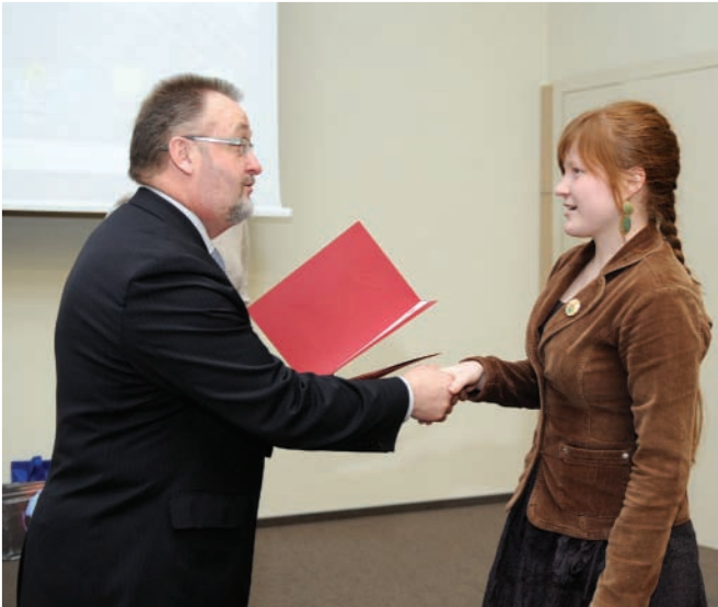
SVAJONĖS. Konkursą „Mano svajonių profesija“ laimėjo savo svajones originaliausiai aprašę ar iliustravę Lietuvos moksleiviai.

Kovo 17 dieną, per atvirų durų dieną, Klaipėdos universitete apdovanoti Lietuvos 9–12 klasių moksleivių rašinių ir fotografijų konkurso „Mano svajonių profesija“ laureatai. Konkursą organizavo Klaipėdos universiteto Informacijos ir ryšių su visuomene skyrius drauge su Klaipėdos miesto dienraščiu „Vakarų ekspresas“.