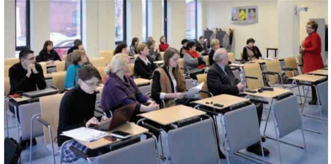
APLINKOSAUGA. Seminare buvo dalijamasi patirtimi ir aptariama, kokie metodai taikomi, kad į aplinką nepatektų infekuotos gydymo įstaigų atliekos.

„Eco4Life“ (Aplinkos ir gyvybės mokslų tinklo kūrimas Pietų Baltijos regione bendradarbiavimo skatinimui abipus sienų) – tai projektas, kurį įgyvendina Klaipėdos universitetas drauge su „BioConValley“ (Vokietija) ir Pomeranijos universitetu (Lenkija).