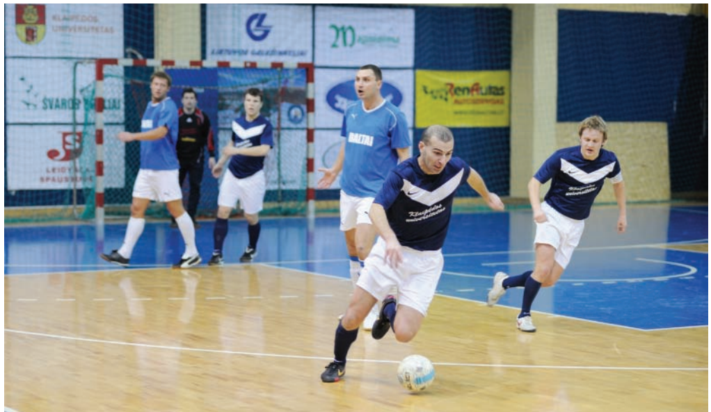
VĖL ANTRI. KU futbolininkai vėl tapo vicečempionais – Lietuvos studentų futbolo varžybose iškovojo antrąją vietą.

Vilniuje vyko Lietuvos studentų futbolo varžybos, skirtos Lietuvos nepriklausomybės dienai pažymėti. Klaipėdos universiteto komanda iškovojo antrąją vietą, įveikusi VDU (1:0), LEU (4:1), ASU