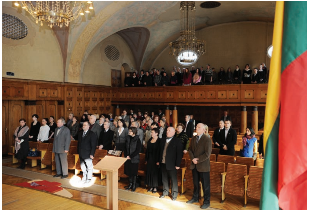
DATA. Kovo 11-oji itin svarbi ir Klaipėdos universitetui – uostamiesčio universitetas įsteigtas jau nepriklausomoje Lietuvoje. Iki tol buvo manoma, kad Lietuvai užteks vieno universiteto Vilniuje.

Lietuvos nepriklausomybės atkūrimo diena Klaipėdos universitete buvo minima kovo 8 dieną Menų fakulteto Koncertų salėje. Renginio metu buvo ne tik minima Lietuvos nepriklausomybės atkūrimo diena, bet neužmiršta pasveikinti ir moterų.